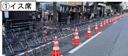
観覧席設置イメージ