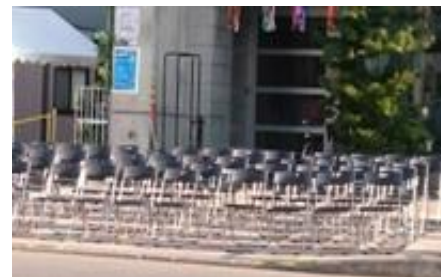
※写真は過去のもので参考イメージです。