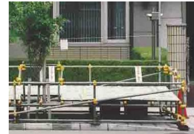
棧敷席は靴を脱いで座ります。