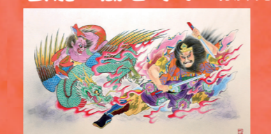
JRねぶた実行プロジェクト