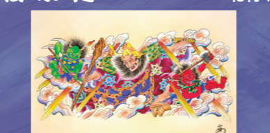
あおもり市民ねぶた実行委員会