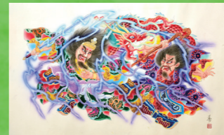
青森県板金工業組合