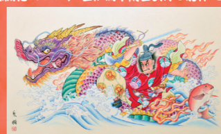
マルハニチロ俊武多会