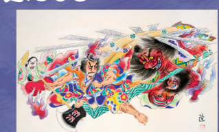
に組・日本風力開発グループ