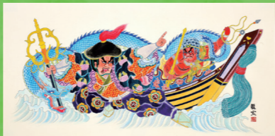
公益社団法人 青森青年会議所