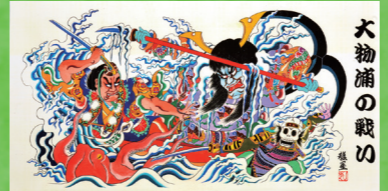
消防第二分団ねぶた会・アサヒビール