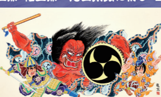
東北電力ねぶた愛好会