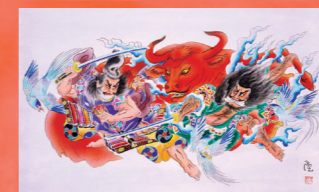
ヤマト運輸ねぶた実行委員会