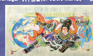
プロクレアねぶた実行プロジェクト