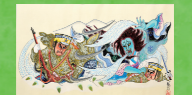
青森自衛隊ねぶた協賛会