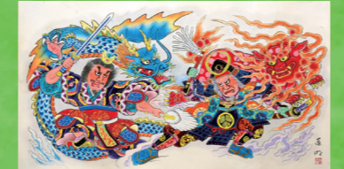
パナソニックねぶた会