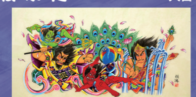
県庁ねぶた実行委員会