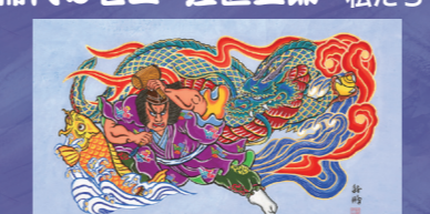
私たちのねぶた自主製作実行委員会