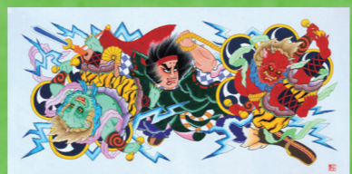
日本通運ねぶた実行委員会