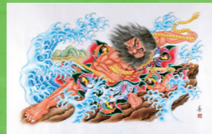
日立連合ねぶた委員会