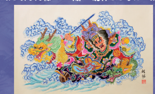
青森市役所ねぶた実行委員会