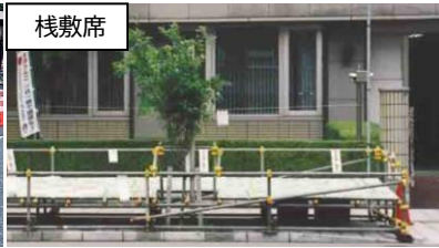
傾斜のついた座面に靴を脱いで座ります