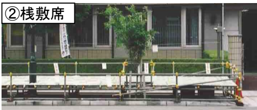
※傾斜のついた座面に、靴を脱いで座っていただきます。