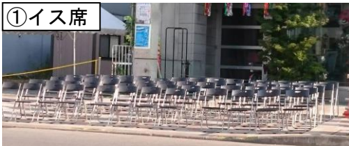
※写真は過去のもので参考イメージです。