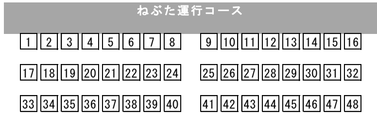
観覧席設置イメージ