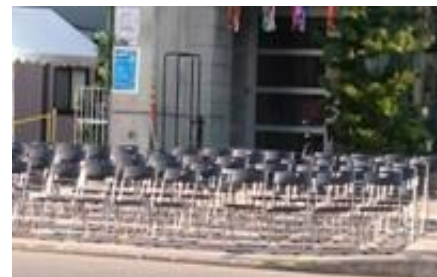
※写真は過去のもので参考イメージです。