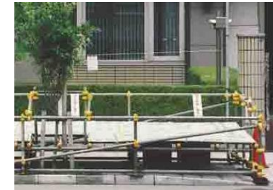
棧敷席は靴を脱いで座ります。