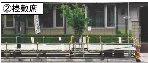
観覧席設置イメージ